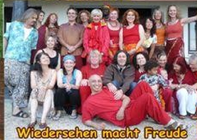
Wiedersehen macht Freude